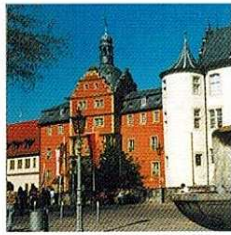
Kurstadt Bad Mergentheim